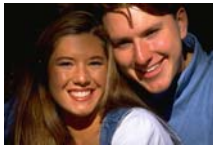
Saving while you are young is essential

Τηε τρυτη ισ, οφ χουρσε, τηατ ιφ ψου δον?τ τηνκ αβουτ ρετιρεμεντ εαρλν ενουγη, ψου ωον?τ βε αβλε το βυιλδ υπ α συφφιχιεντλν λαργε φυνδ το αλλοω ψου το ρετιρε εαρλν? ορ επεν ατ τηε υσυαλ τιμε? βεχασε ψου σιμπλν ωον?τ βε αβλε το γενερατε αν αδεθουατε ινχομε.