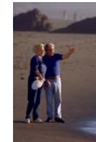
You decide your own direction

When you come to retire, any money invested in a personal or Stakeholder pension must be used to purchase an annuity – that is an income provided by an insurance company, in return for you giving up the capital, altogether.